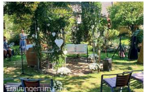
Hängungen im Park

Bei Uns können Sie feiern. Sprechen Sie uns an ! Hochzeiten-, Firmen-, Geburtstagsereignisse... mit bis zu 120 Personen.